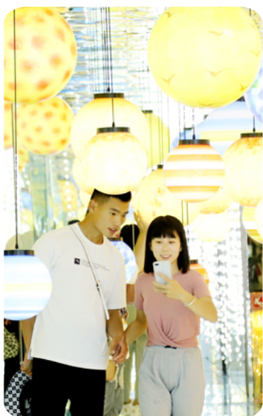
和星球灯合影，留下美好的记忆。

作为目前国内面积最大的星空艺术馆，该展馆由星空博物馆、失恋博物馆、能量发泄馆、全息互动体验馆4大主题场景、30余个展厅组成，馆内美轮美奂、靓丽多姿的空间布局，为广大市民和游客的视觉听觉触觉带来了全新的感官体验。徜徉其中，人们仿佛置身虚拟世界，奇幻乐趣无穷。