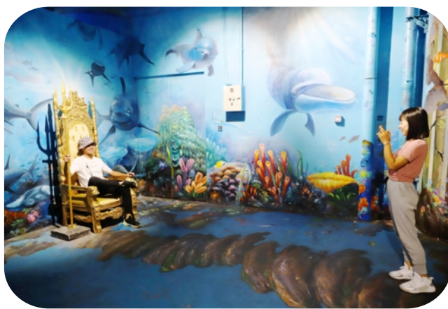
游客探秘蓝色海洋的深邃。