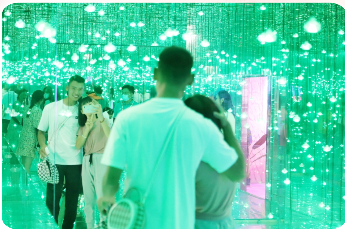
层层叠叠的灯盏不断变幻色彩，让游客犹如置身水晶宫。