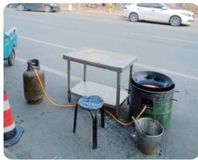
放置在道路上的燃气罐。

近日,天气炎热,街道有部分路段的一些饭店商户将煤气罐放在门前人行道或行车道上,以方便自己在室外摆摊经营。而大街上人来人往,存在极大安全隐患。