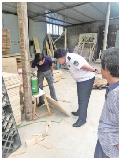
工作人员排查安全生产隐患。

通过此次安全生产专项整治行动,摸清辖区内“多合一”院落底数,督促生产经营单位“守红线、筑底线”,严格落实安全生产主体责任,绷紧安全生产弦,规范“多合一”院落安全生产管理,促进了安全生产环境持续改善、安全生产状况稳定好转,为我街生产安全形势持续稳定提供保障。