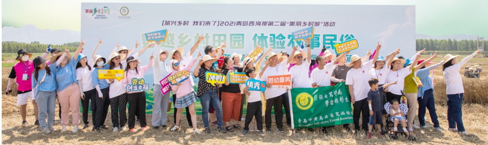
▼2021青岛西海岸第二届“美丽乡村游”活动吸引了众多游客参与。

流量的共享,让更多市民游客及时获取了新区文旅资讯;资源的共享,让更多本地文旅市场主体成功合作,携手共渡难关;市场的共享,让更多国内外文旅企业感知到了新区文旅市场的活力。下一步,旅投集团将继续加强与区文旅局等相关部门的工作协同,强化顶层设计,坚持规划引领发展,进一步整合西海岸新区内外文旅资源,发展具有新区特色、吸引力强的旅游业态,与新区文旅共同迎接时代挑战,书写新的文旅篇章。(李涛)