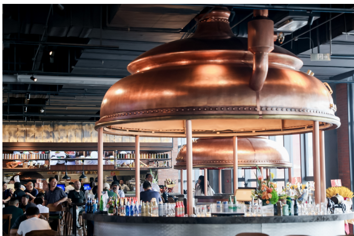
品类齐全的美酒汇聚啤酒花园，让游客尽享“啤酒狂欢”。

啤酒厂就在餐桌旁，拧开水龙头即能喝到纯正的青岛啤酒？这个真的可以有！在位于金沙灘啤酒城的青岛啤酒·时光海岸精酿啤酒花园，游客不仅能喝到24款刚刚生产出来的精酿啤酒，还可以围坐桌前观看啤酒生产过程。这座占地两万平方米的啤酒花园涵盖1903时光精酿工坊、啤酒主题度假酒店、威士忌俱乐部、汤谷啤酒SPA、1903面包坊、婚恋基地等六大时尚业态场景，一跃成为全球首创、规模最大、业态最全、体验最丰富的沉浸式啤酒+消费生活体验MALL。