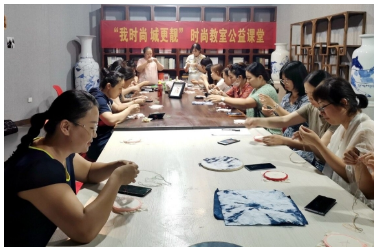
学员们在时尚课堂学习刺绣。□记者 王培珂 报道

“我时尚 城更靓”女性时尚工程是新区妇联落实青岛建设时尚城市的目标而发起的攻势之一，自2019年启动以来，受到新区广大妇女群众的热烈欢迎，已为新区女性提供了100多场时尚课程，受益群众近万人。今