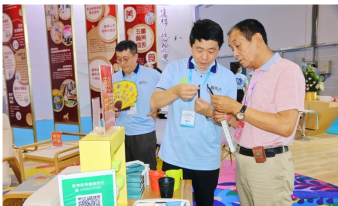
工作人员向参会人员介绍产品。

求,融海康养产业研究院带来了自主研发的适老化产品:符合人体工学的陪伴系列沙发、适老化的拥抱系列休闲椅……所有适老化设计,都源于“始于精研,归于精简”的设计理念,为居家老人构造一个安全的居家环境,该理念获得了众多来宾和媒体的肯定及赞扬。