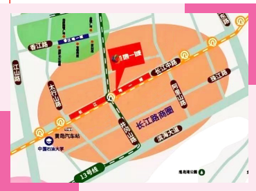
“长江地一城”项目区位图

“长江地一城”项目无疑作出了积极探索和有益尝试。一座既能完善城市功能,又能满足社会需求的特色街区,一个极具海洋特色的“不夜城”超级城市IP,在西海岸新区呼之欲出!