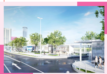
项目沿街打造景观轴廊。(效果图)