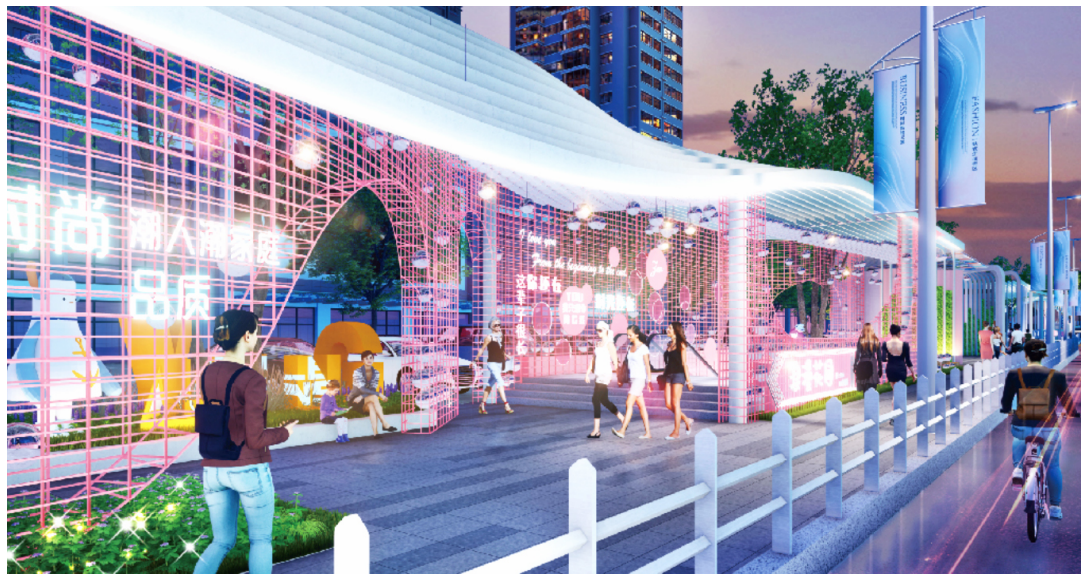
『长江地一城』项目地上景观效果图

近日,西海岸新区“长江地一城”项目的地上景观设计及亮化方案,正式通过相关专家和有关部门评审,这个投资近20亿元的商业“巨无霸”再次引发社会各界关注。在各城市争相打造文旅IP、激活城市“流量密码”的当下,“长江地一城”项目究竟能为区域经济社会发展带来哪些积极效应?这个充分借鉴国内成熟经验,并结合本地实际精心打造的地下商业综合体,能否成为现象级的超级城市IP?国内多个城市纷纷推进城市更新的大背景下,这个主要由社会资本投资的项目,对推动城市发展模式和发展理念的转变又有哪些借鉴意义?记者近日进行了探访。