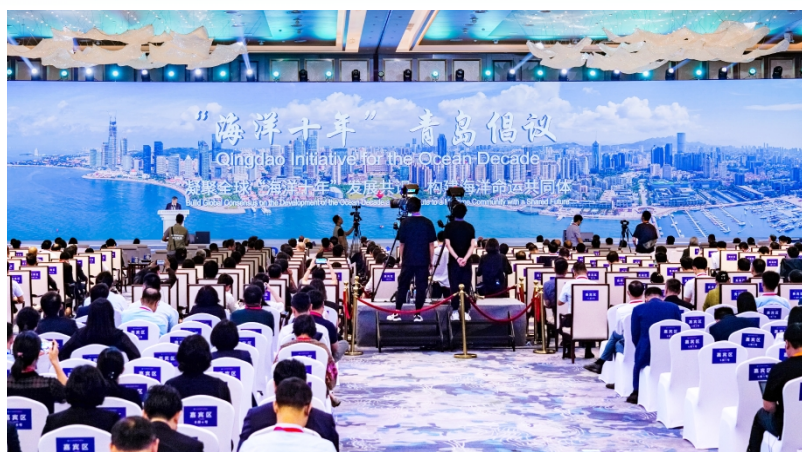
2023东亚海洋合作平台青岛论坛开幕式上,“海洋十年”青岛倡议发布。

山东省海洋科技成果转移转化中心(创新创业共同体)、“海洋十年”国际海洋场景创新合作中心也在开幕式上揭牌。其中,创新创业共同体是山东省政府批准建设的省级创新创业共同体,由山东海洋集团有限公司牵头,联合山东省海洋科学研究院、中科院海洋所等单位共同建设,包含地方政府、科研院所、骨干企业等理事单位29家。创新创业共同体以提高山东省海洋科技成果转化能力、发展壮大海洋产业为目标,重点围绕海洋信息技术、海洋生物医药、海洋清洁能源、海水资源利用、海洋碳汇等五个海洋特色新兴产业发展,聚焦八个细分领域产业链条,重点推进六大建设任务,凝聚“政产学研