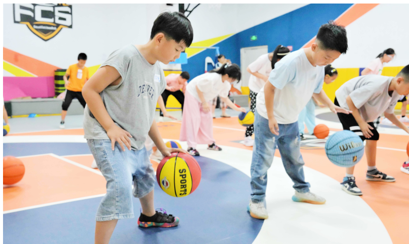
暑期“爱心托管驿站”点亮孩子快乐假期。

沂河路社区工会依托新时代文明实践站、特色网格服务站、社区图书馆等文明实践阵地,积极探索“社区+机构+志愿者”服务模式开设暑期爱心托管驿